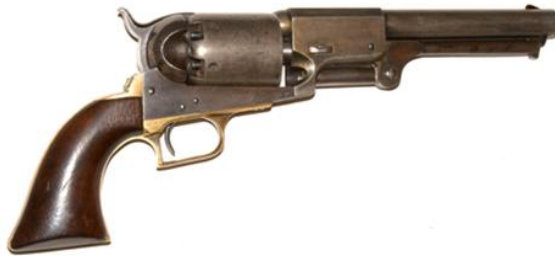
Uno dei revolver Colt Dragoon in dotazione dei mille

Dati i tempi di trasporto è improbabile che le armi ordinate siano arrivate tutte in tempo per la spedizione di maggio, ma se anche così fosse stato il volume di fuoco sviluppabile a breve distanza dai soli 94 revolver a tamburo era impressionante e non paragonabile a quello dei fucili dei soldati napoletani. Forse fu anche questa la ragione che a Calatafimi spinse il generale ad ordinare una disperata carica alla baionetta per accorciare le distanze e portare al fuoco le pistole. Tattica che si dimostrò vincente.